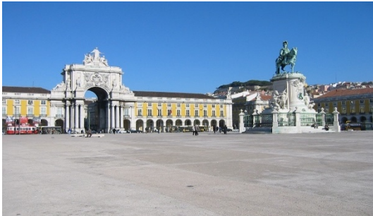
Terreiro do Paço