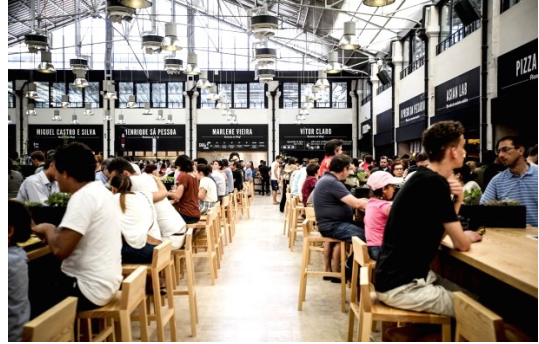
Mercado da Ribeira