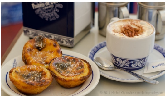
Pastéis de Belém