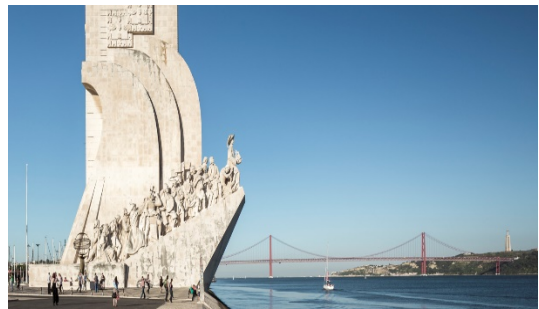
Padrão dos Descobrimentos