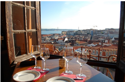
Restaurante/Bar Chapitô à Mesa