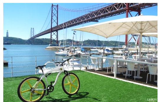
Docas de Santo Amaro