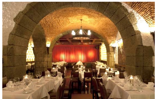
Café Luso Fado < www.cafeluso.pt >