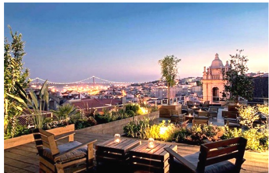
Bar Park no Bairro Alto