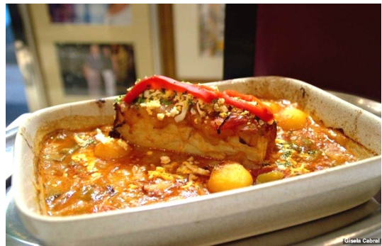
Restaurante Solar dos Presuntos