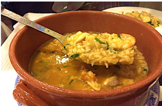
Restaurante A Maritima do Restelo