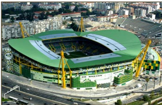
Estádio de Alvalade