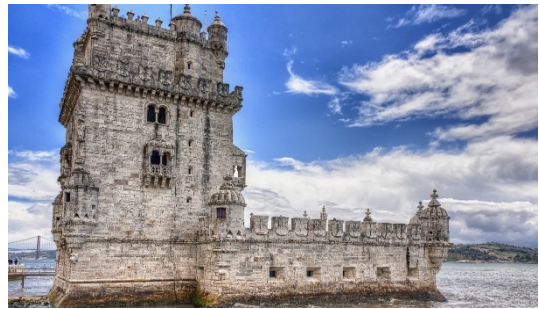
Torre de Belém