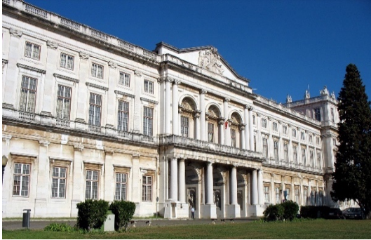
Palácio da Ajuda