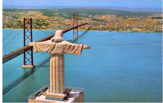
Cristo Rei e Ponte 25 de Abril