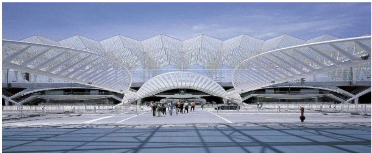
Estação do Oriente