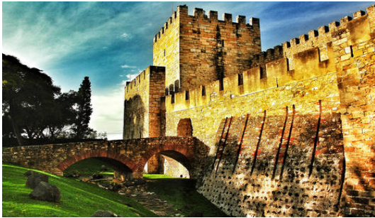
Castelo de São Jorge

Alameda Metro Station → Baixa-Chiado Metro Station (Green Line - 6 stops)