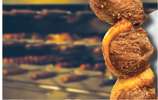
Restaurante Fogo do Chão