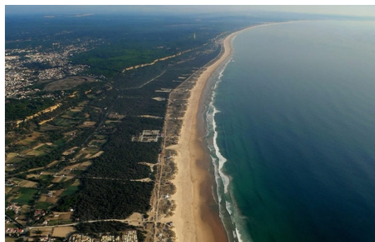
Costa da Caparica