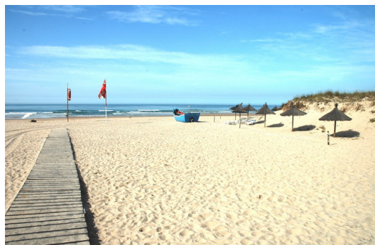
Costa de Caparica