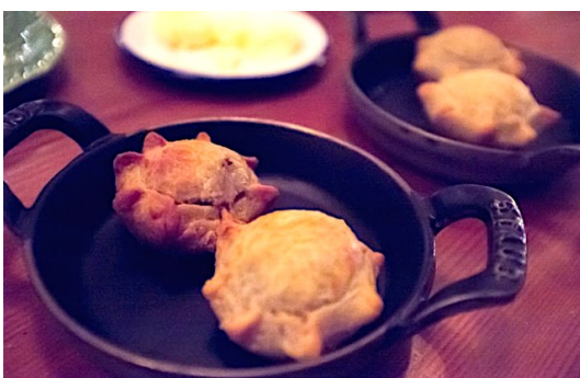
Restaurante Cantinho do Avillez