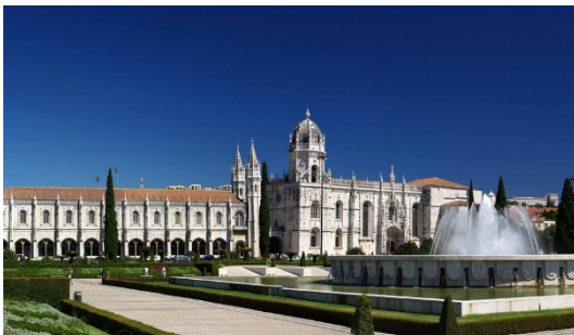
Mosteiro dos Jerónimos