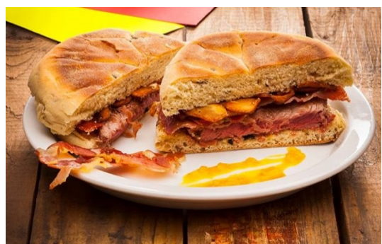
Restaurante O Prego da Peixaria