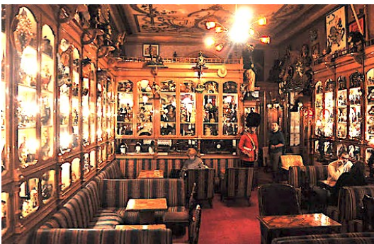
Bar Pavilhão Chinês