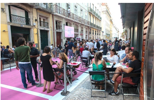
Rua Cor de Rosa no Cais do Sodré