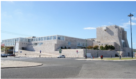
Centro Cultural de Belém

Alameda Metro Station → Cais do Sodré Metro Station → Tramway or train to Belém (around 40min)