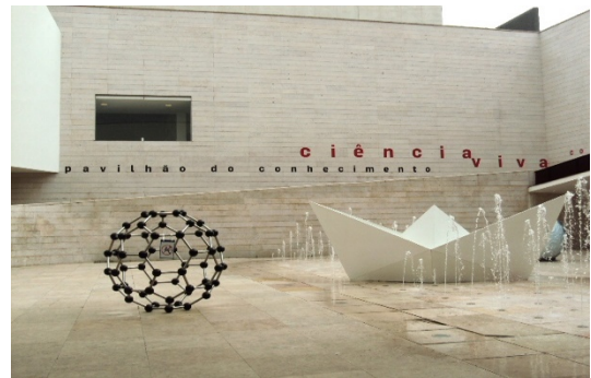
Museu da Ciência