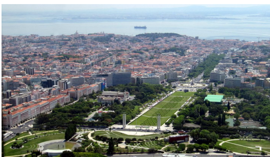
Av. Da Liberdade