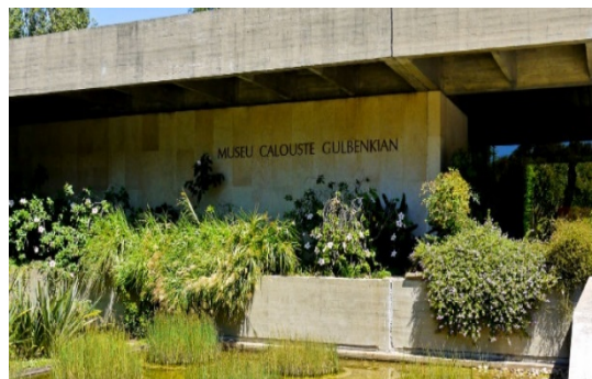
Fundação Calouste Gulbenkian