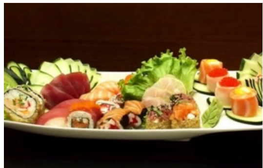
Sushi Suntory Picoas