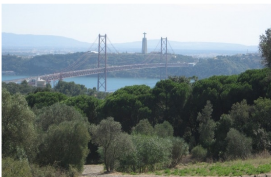
Jardim de Monsanto