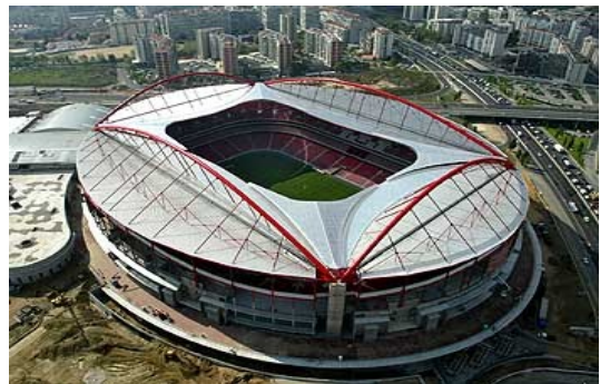
Estádio da Luz